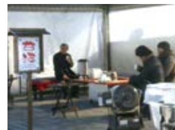
甘酒で一息ついて