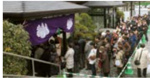
お焼香を待つ方々の行列