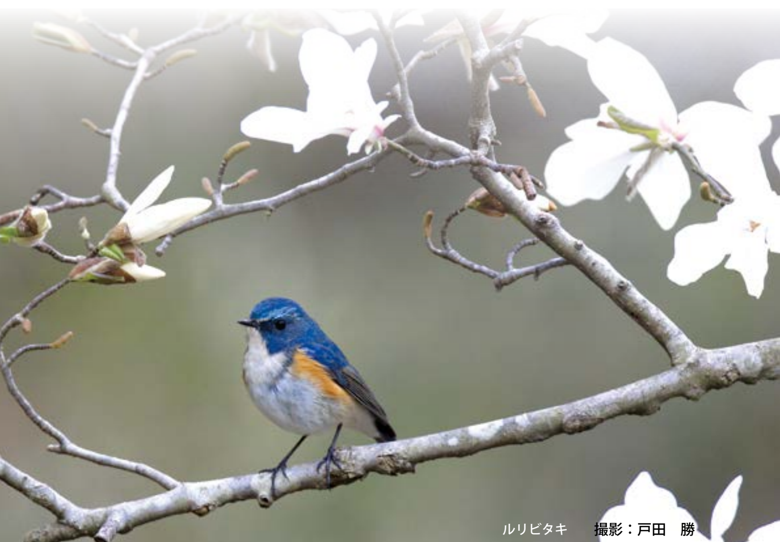
ルリビタキ