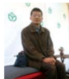
奥様とお参りは欠かしません