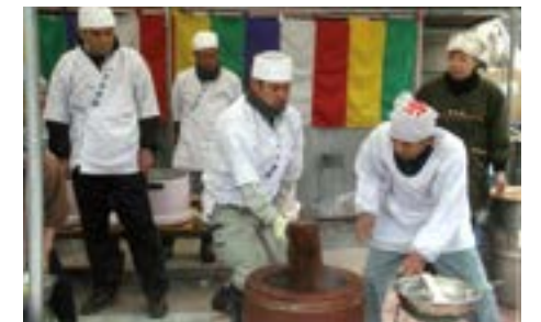
スタッフ総出で振る舞いのお餅つき